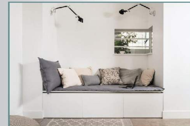
Ngoài ra, bố trí ánh sáng hợp lý, tận dụng được ánh sáng tự nhiên tối đa giúp căn phòng luôn thoáng đãng, thậm chí có thể sử dụng cả những "góc chết" như gầm cầu thang để làm thành nơi đặt giường ngủ êm ái mà không lo ngộp hay bí bách.