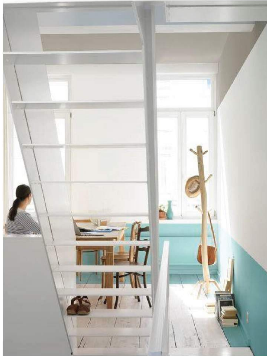
Phong cách giản dị đơn thuần với tông trắng chủ đạo, chỉ cần thêm một mảng màu xanh thiên thanh dưới chân tường là khiến căn phòng nhỏ như trải rộng ra mãi.

Sống ở thành thị "tắc đất tắc vàng", nên hầu hết các gia đình đều tận dụng triệt để diện tích khu đất nhà mình để xây dựng, nhưng không gian sinh hoạt chung và phòng riêng vẫn thường rất nhỏ vì "đất chật người đông".