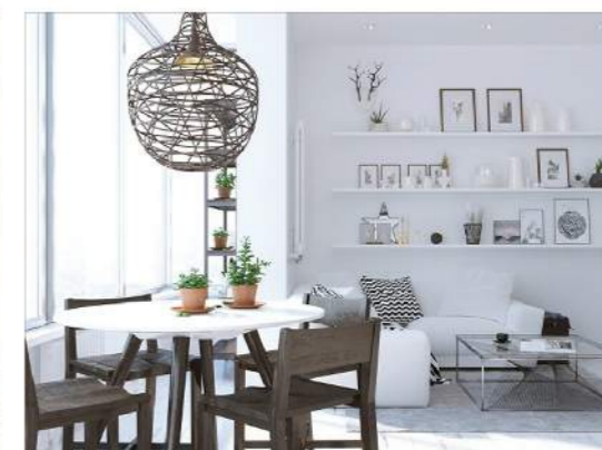
Phòng ăn mang phong cách trẻ trung khi có những giá gỗ gắn trên tường để tranh ảnh, lọ hoa và những vật dụng trang trí khác.