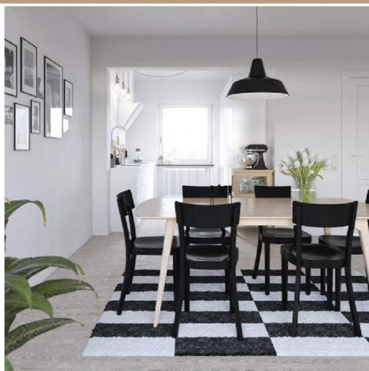
Phòng ăn này có nét độc đáo gồm những chiếc ghế màu đen được đặt trên tấm thảm có ô màu trắng-đen đan xen.