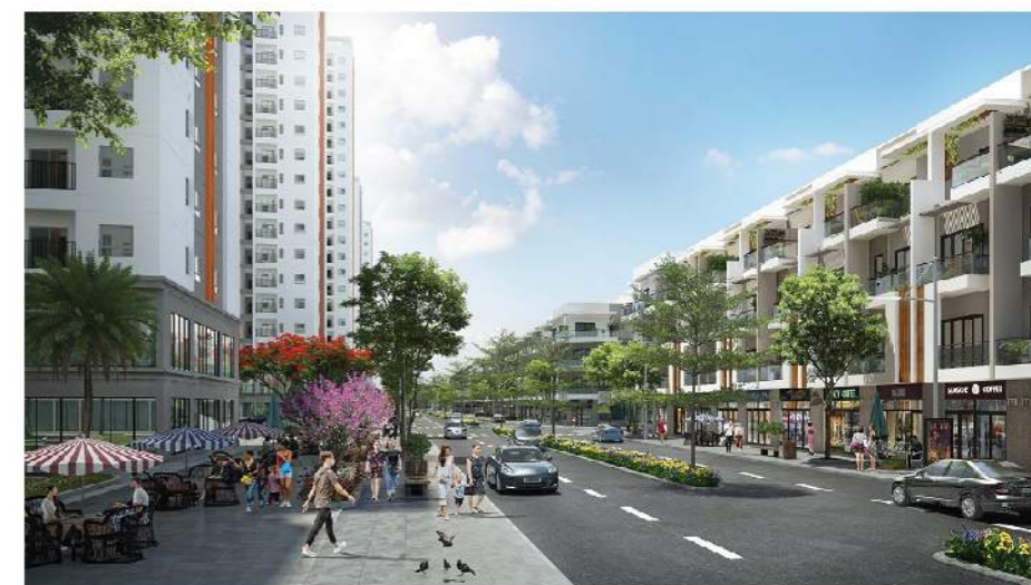
Him Lam Green Park đặc biệt chú trọng đến yếu tố cộng đồng.

Giải thưởng Bất động sản Việt Nam thuộc hệ thống Giải thưởng Bất động sản châu Á (Asia Property Award), là giải thưởng uy tín do tập đoàn PropertyGuru (tập đoàn bất động sản trực tuyến hàng đầu châu Á) tổ chức thường niên nhằm tôn vinh giá trị của các dự án bất động sản tốt nhất Việt Nam ở các lĩnh vực: nhà ở, khu phức hợp và khu thương mại.