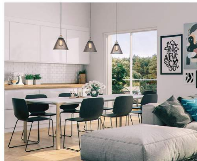
Căn phòng này có cửa ra vào gần với khu vườn, giúp các thành viên trong gia đình vừa ngồi ăn uống vẫn có thể ngắm cảnh vật thiên nhiên.