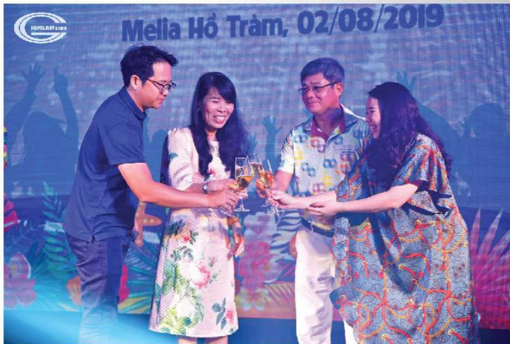
Toàn thể CBNV Công ty Him Lam Land đã có một chuyến team building đầy ý nghĩa tại khu nghỉ dưỡng 5 sao Melia Hồ Tràm.

động với đại tiệc âm nhạc đầy màu sắc với 8 tiết mục biểu diễn thời trang bikini được dàn dựng công phu. Bên cạnh các tiết mục biểu diễn trang phục bikini cực chất, các thành viên còn sáng tạo kịch bản biểu diễn mới lạ và độc đáo. Từ việc lồng ghép gameshow Người giấu