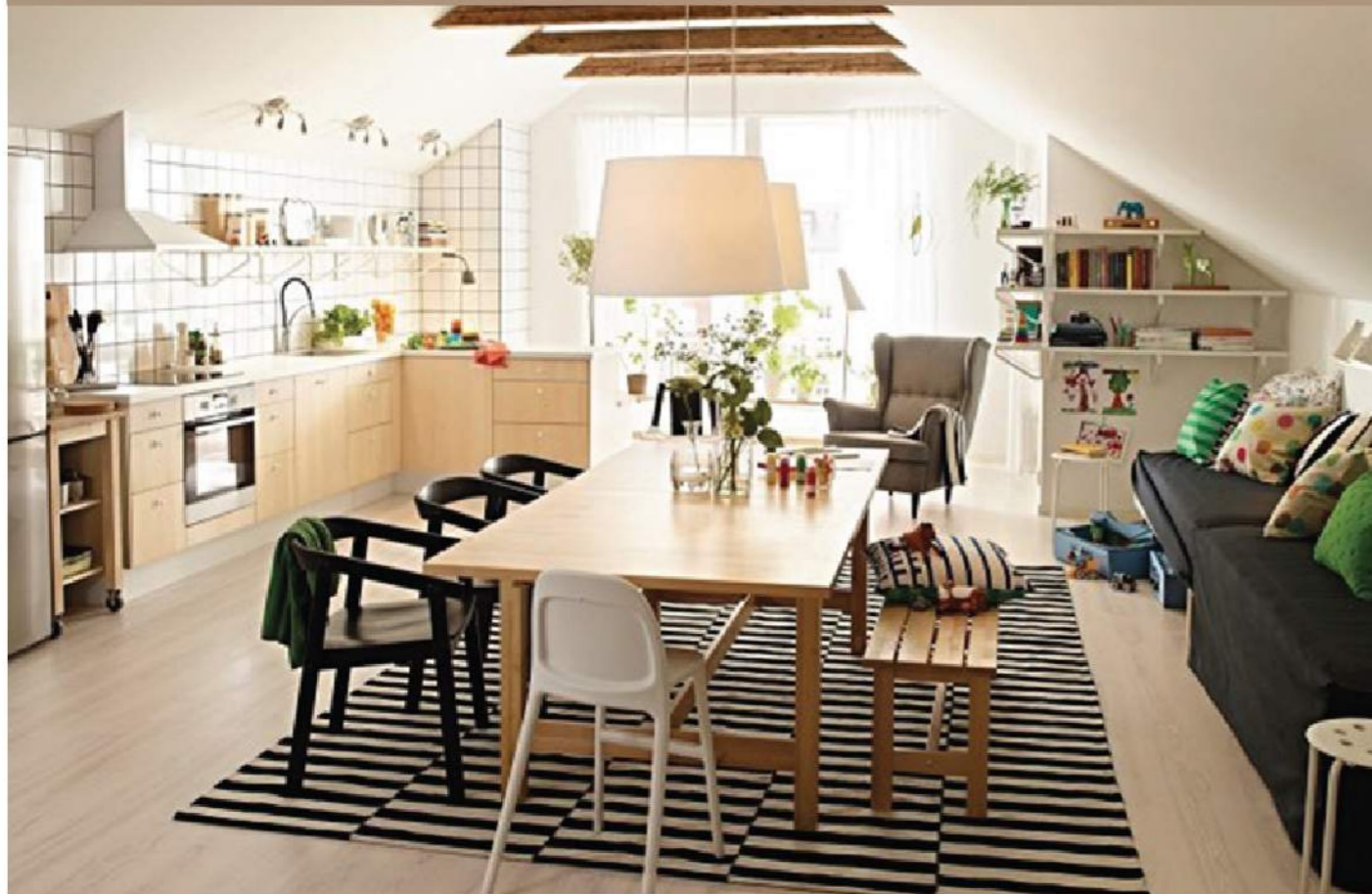
Bàn ăn, tủ bếp và sàn nhà được làm bằng gỗ có vân màu vàng sáng góp phần bừng sáng cho căn phòng. Những chiếc ghế màu đen và thảm trải sàn kẻ sọc màu trắng đen làm nổi bật hơn cho phòng ăn.

Từ cách chọn lựa kiểu dáng, màu sắc cho bộ bàn ghế và bày biện các đồ vật, bạn sẽ có được phòng ăn mang phong cách hiện đại, lịch sự đón khách.