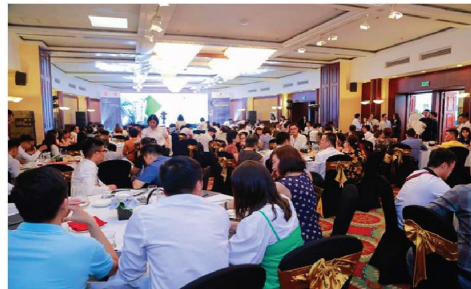
mua hàng đầu phía Tây thủ đô.

Tại phân khúc cao cấp, dự án Goldmark City (136 Hồ Tùng Mậu) đang truyền thông mạnh chính sách tặng gói nội thất lên tới 239 triệu, cùng mức chiết khấu 7,99%. Dự án Golden Park (số 2 Phạm Văn Bạch, Cầu Giấy) với chính sách tặng sổ tiết kiệm 50 triệu, miễn phí dịch vụ 2 năm đang được xem là hai dự án chung cư đang