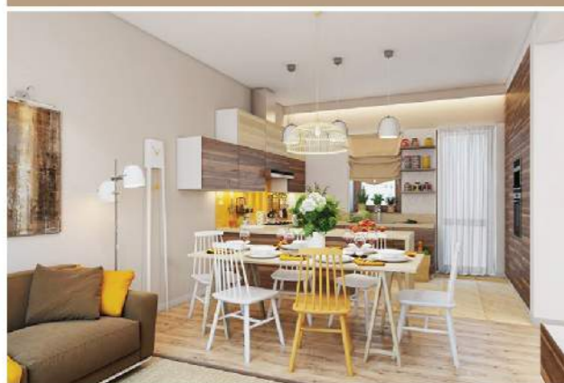
Bộ bàn ghế màu trắng có duy nhất một chiếc màu vàng là điểm độc đáo cho phòng ăn. Những chiếc đèn treo rủ xuống khiến cho căn phòng trở nên sang trọng hơn.