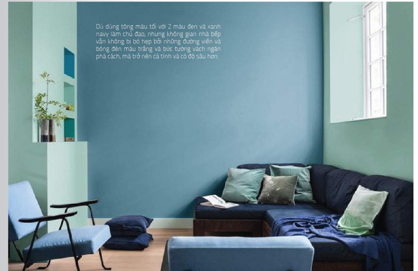
Dù dùng tông màu tối với 2 màu đen và xanh navy làm chủ đạo, nhưng không gian nhà bếp vẫn không bị bó hẹp bởi những đường viền và bóng đèn màu trắng và bức tường gạch ngăn phá cách, mà trở nên cá tính và có độ sâu hơn.