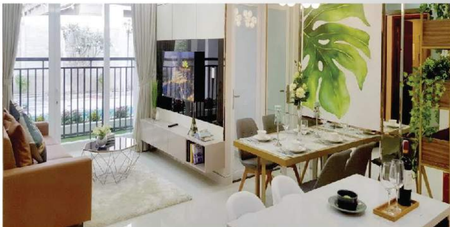
Theo chuyên gia phong thủy, việc mua nhà đất tháng “cô hồn” không ảnh hưởng gì đến vận mệnh của gia chủ

kinh sách truyền lại, tháng 7 nhà Phật dùng để mở các Pháp đàn Chẩn Tế Xả Tội Vong nhân, qua đó các kinh Sư lập đàn triệu tập vong linh từ địa ngục về nghe khai thị, sám hối và được siêu độ. Như vậy, triết lý tháng 7 là tháng thả “cô hồn” lang thang hoàn toàn chỉ là quan điểm dân gian, không có căn cứ.