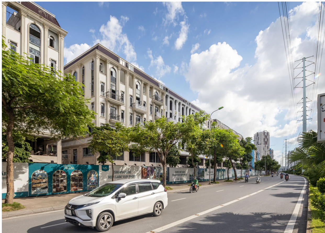
Tọa lạc tại vị trí “kim cương” ngay trung tâm quận Hà Đông, Him Lam Vạn Phúc trở thành tâm điểm hút giới đầu tư Thủ Đô ngay từ khi ra mắt

Với lợi thế tọa lạc trong vùng quy hoạch có hạ tầng đồng bộ và hiện đại, nơi được xem là một trong những khu vực có tốc độ phát triển kinh tế nhanh chóng, đô thị hóa cao, tập trung nhiều hệ thống giáo dục, y tế,... Him Lam Vạn Phúc sẽ góp phần gia tăng chất lượng cũng như môi trường sống cho cư dân.