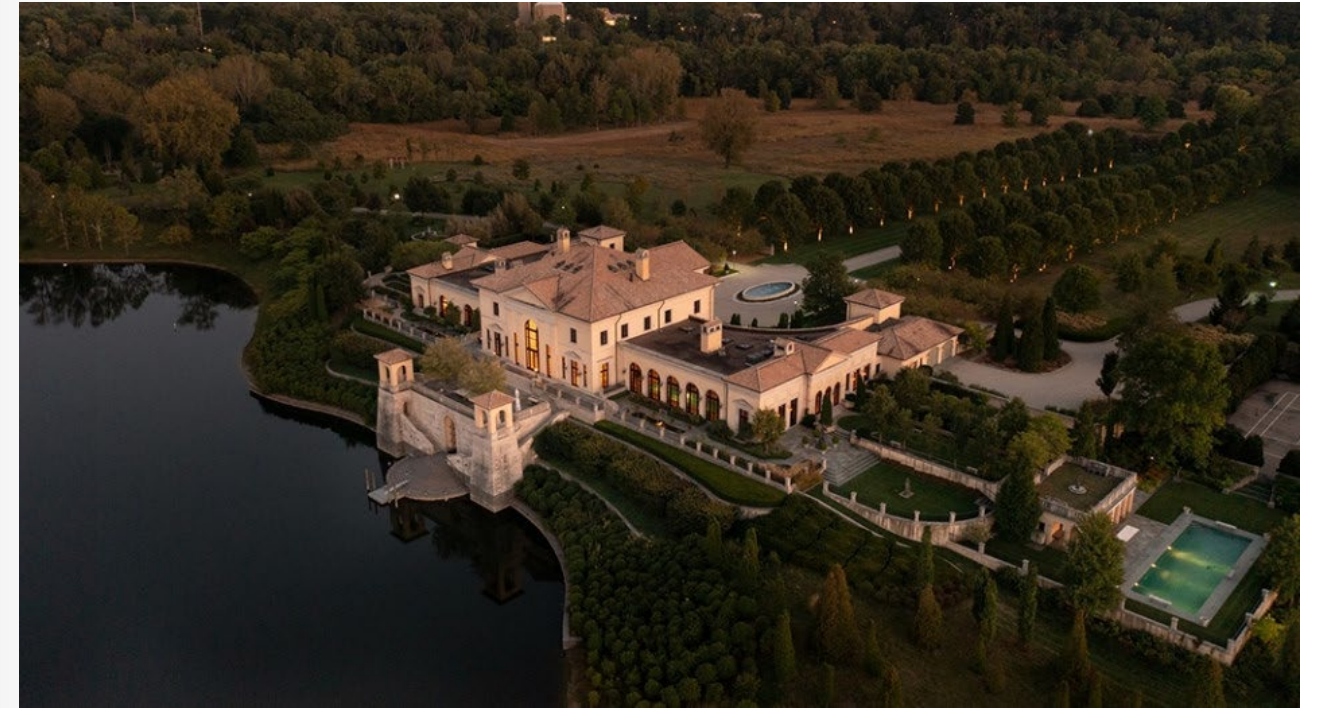
Ngôi nhà ven hồ có bến tàu riêng