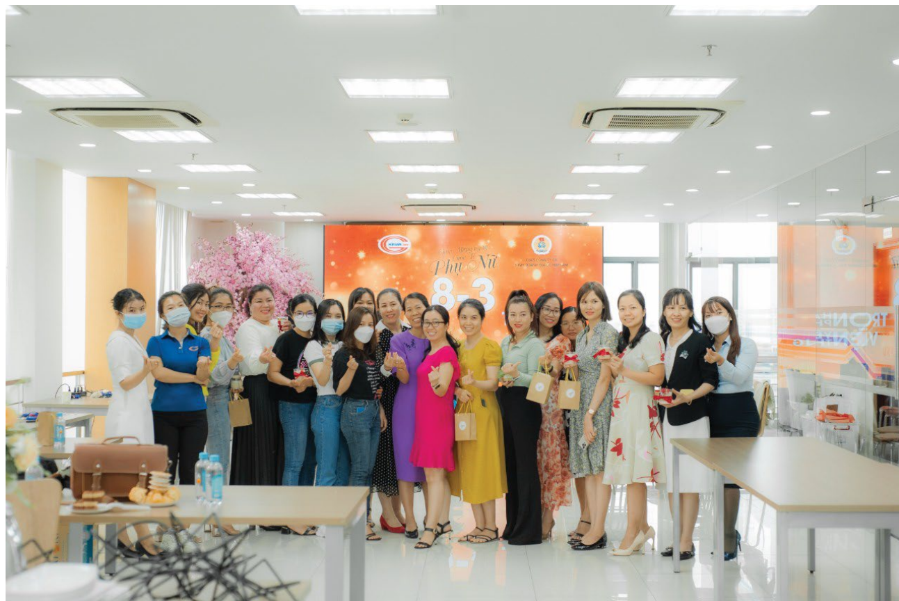
“Bóng hồng” tại các phòng ban chụp hình kỷ niệm

Chương trình workshop diễn ra trong không gian ấm cúng và thân mật. Từ các nguyên liệu được cung cấp sẵn như sáp nến, tinh dầu và dụng cụ trang trí, các chị em đã được trải nghiệm tự tay làm ra cây nến thơm nghệ thuật với mùi hương yêu thích.