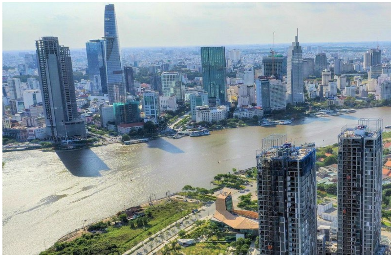
Dự án nằm trong lõi trung tâm khu đô thị Thủ Thiêm và ven sông Sài Gòn. Ảnh: VIỆT HOA

Yếu tố tiếp theo chính là việc sắp xếp lại địa giới hành chính các địa phương tại TP. HCM và nhiều tỉnh thành phía Nam. Câu chuyện "nóng" nhất thời gian qua là thành lập TP Thủ Đức trực thuộc TP.HCM khiến giá BĐS tăng mạnh. Việc một địa phương được "lên quận hay lên thành phố" sẽ kích thích kỳ vọng của người dân, nhà đầu tư về các hứa hẹn chính sách hạ tầng, đô thị, dịch vụ, cơ hội kinh doanh... và thế là giá BĐS tăng theo.