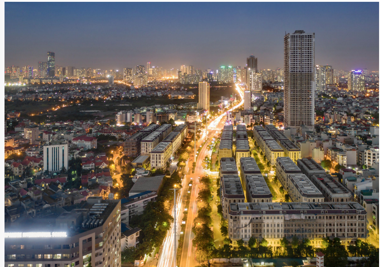
“Paris giữa lòng Phố Lụa” lúc về đêm

Là doanh nghiệp luôn đặt quyền lợi của khách hàng lên hàng đầu, sau thời gian gấp rút thi công, Him Lam Land đã và đang hoàn thiện bàn giao nhà cho khách hàng Him Lam Vạn Phúc. Đây chính là dấu mốc quan trọng, khẳng định thành công của dự án và khẳng định uy tín cùng nỗ lực “vượt bão Covid” của Nhà Phát triển & Kinh doanh Him Lam Land.