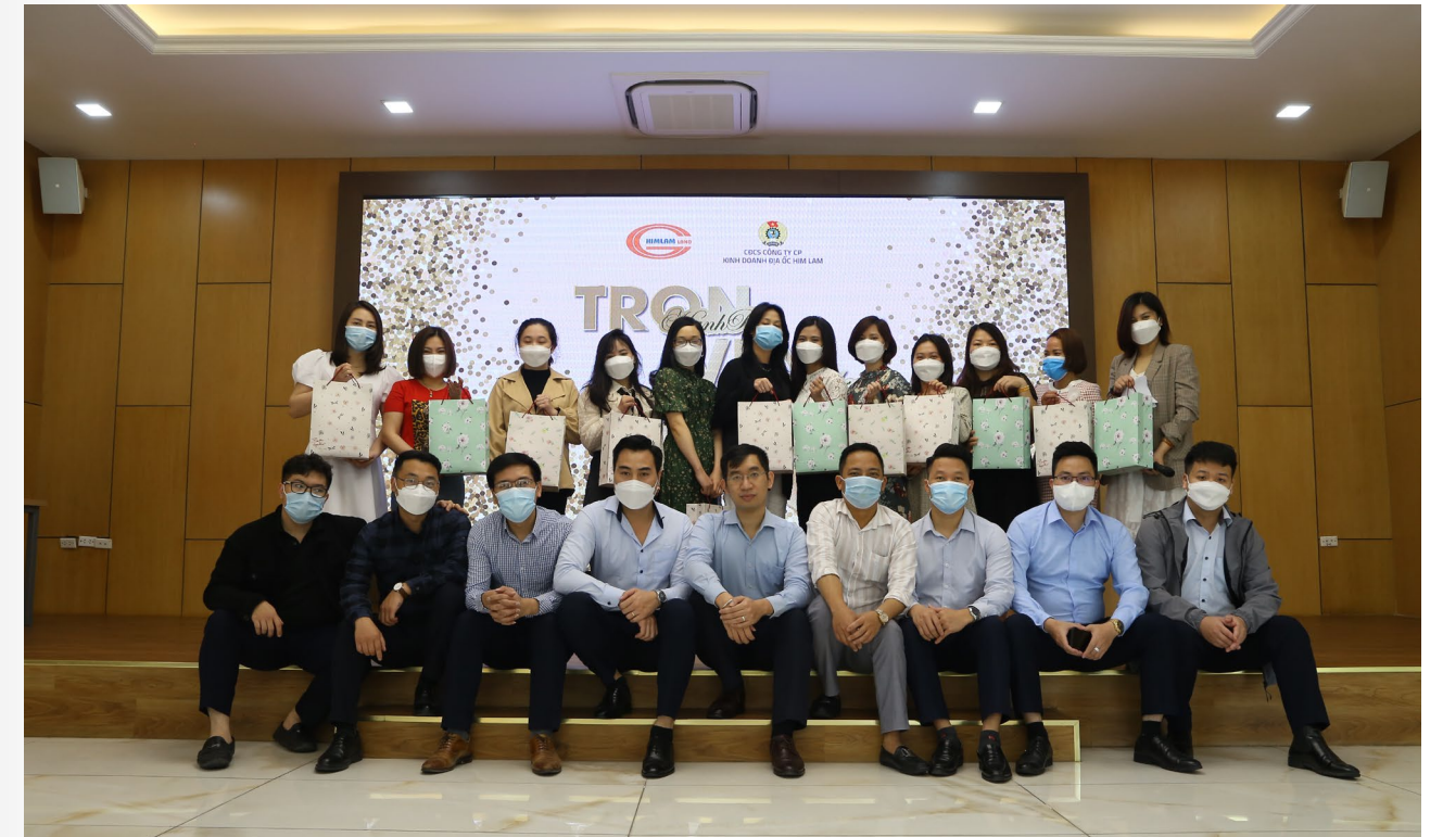
Các đồng nghiệp Him Lam Land trao tặng phái đẹp Him Lam Land (chi nhánh Hà Nội) những phần quà ý nghĩa và đầy thiết thực.

từ đó kết nối các thành viên trong “đại gia đình Him Lam Land” lại gần với nhau, thắt chặt tinh đoàn kết, phát huy tinh thần hăng say làm việc, nâng cao hiệu quả công tác chuyên môn của từng CBCNV.