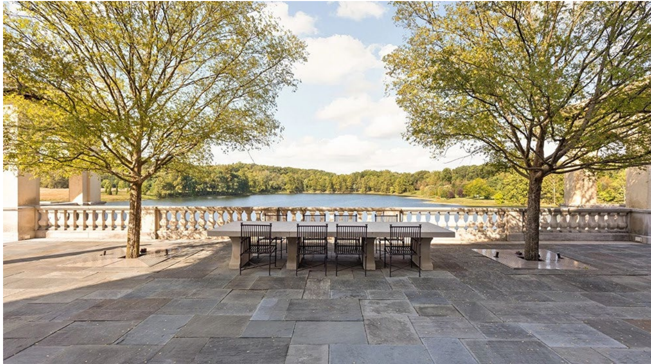
Không gian hội họp ngoài trời