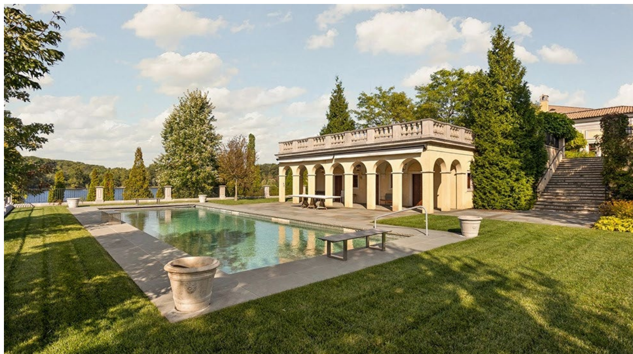
Hồ bơi ngoài trời tại dinh thự