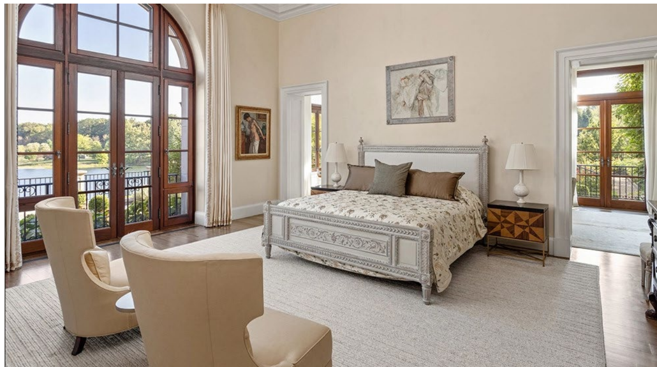
Một trong những phòng ngủ

Phần phía Tây của ngôi nhà sở hữu phòng ăn trang trọng, đủ lớn cho tối đa 30 khách với tầm nhìn hướng ra hồ và những khu vườn xanh tươi. Gần đó là một nhà bếp và khu vực spa trong nhà, với bể bơi nằm bên dưới trần nhà hình vòm cùng cánh cửa mở ra sân hiên lớn. Tại đây còn có phòng tập thể dục, phòng xông hơi khô, mát-xa và tiệm làm tóc.