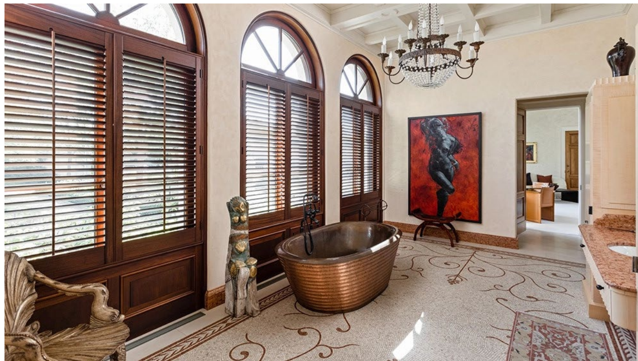
Phòng tắm với bồn ngâm được chế tác bằng đồng