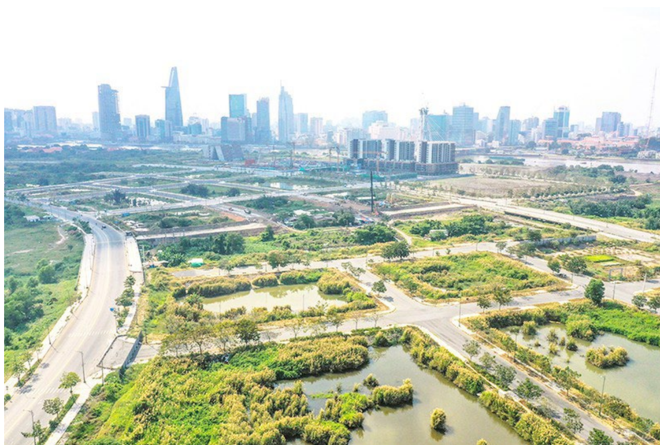
Những lô “đất vàng” tại khu đô thị mới Thủ Thiêm.

Tiếp đó, với mức sống tăng cao, kinh tế của người dân phát triển, xu hướng xây dựng biệt thự nhà vườn giữa lòng trung tâm kinh tế càng lớn. Do đó đây cũng là một nhánh sản phẩm cao cấp hoàn toàn có thể phát triển mà các nhà đầu tư kinh tế hướng đến.