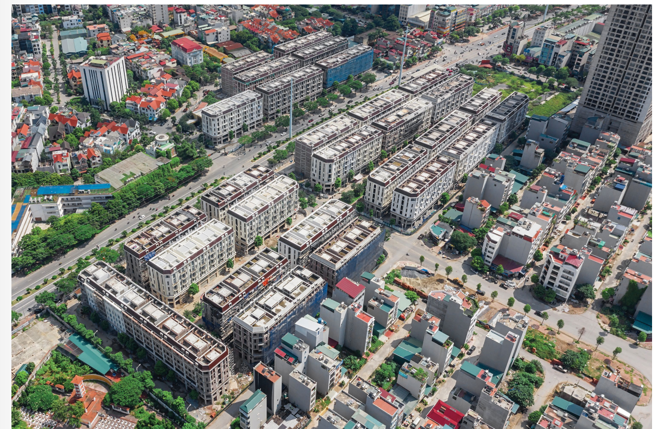
Him Lam Vạn Phúc là nút khai mở cho hành trình Bắc tiến của Him Lam Land

Từ Him Lam Vạn Phúc, cư dân có thể dễ dàng di chuyển đến các địa điểm trọng yếu trong thành phố nhờ tuyến đường huyết mạch như: Đường Lê Văn Lương, tuyến BRT, đường Nguyễn Trãi, đường sắt Cát Linh - Hà Đông, đường vành đai 3... Thêm vào đó, với vị trí cửa ngõ phía tây của Thủ đô, khả năng kết nối với các tỉnh thành vô cùng thuận tiện.