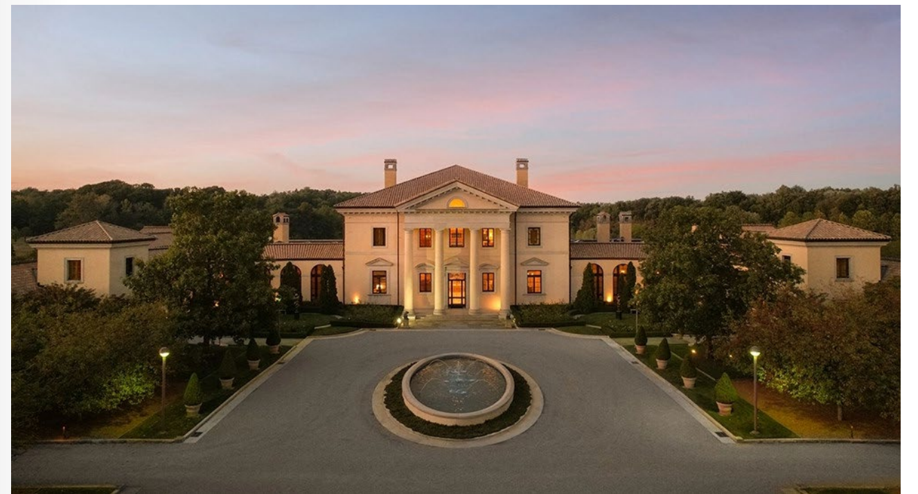
Mặt tiền thoáng đãng của ngôi nhà