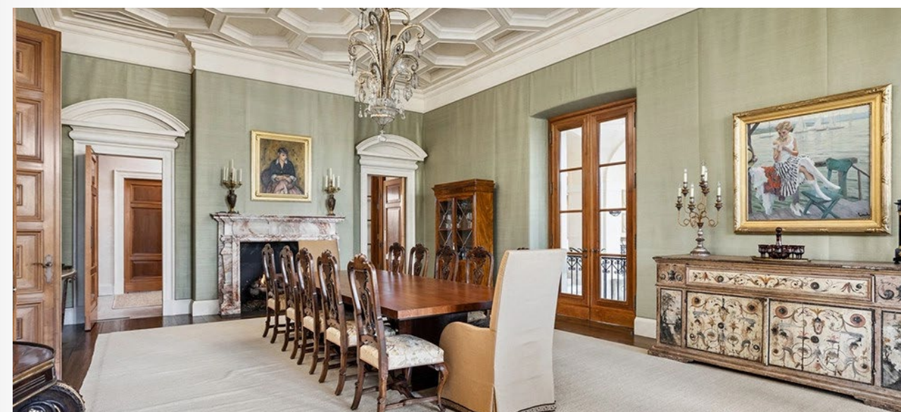
Phòng ăn nằm trong khu vực nhà chính

Từ cổng ngoài hướng ra đường North Michigan, bạn sẽ trông thấy một đường lái xe rải sỏi bao quanh toàn bộ khu nhà. Đi dọc theo con đường chính rợp bóng cây dài gần 1 cây số, bạn sẽ đến một sân vận động quy mô lớn với một đài phun nước trang trí công phu ở trung tâm.