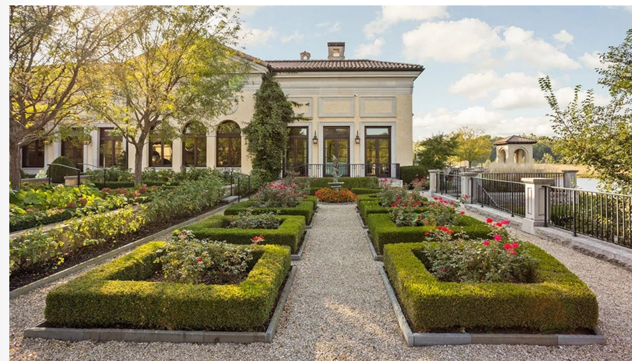
Một phần của khu vườn

Một điểm nhấn đáng chú ý khác là khu vực bậc thang ven hồ ở phía sau ngôi nhà chính, nơi hoàn hảo để giải trí. Tại đây có vọng lâu lợp ngói ở mỗi bên và các bậc thang dẫn xuống bến thuyền ven hồ. Đừng ngạc nhiên khi thấy những thợ lặn chuyên nghiệp của Sở Cảnh sát Indianapolis – họ được phép sử dụng hồ cho các bài tập huấn luyện. Không những thế, Burton còn cho biết thêm biệt phủ vẫn còn 7,3 héc-ta đất nằm ở phía Bắc của hồ đang chờ bạn đến mua.