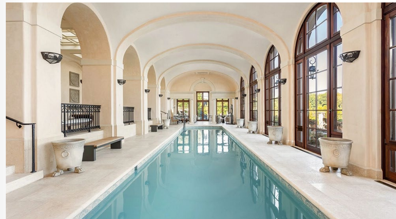
Hồ bơi trong nhà

"Toàn bộ ngôi nhà được lắp đặt hệ thống lọc không khí chuyên dùng trong bệnh viện giúp loại bỏ mọi hạt bụi. Và để đối phó với mùa đông tại Indiana, các tầng trên và sân thượng đều trang bị hệ thống sưởi ấm", Burton cho biết.