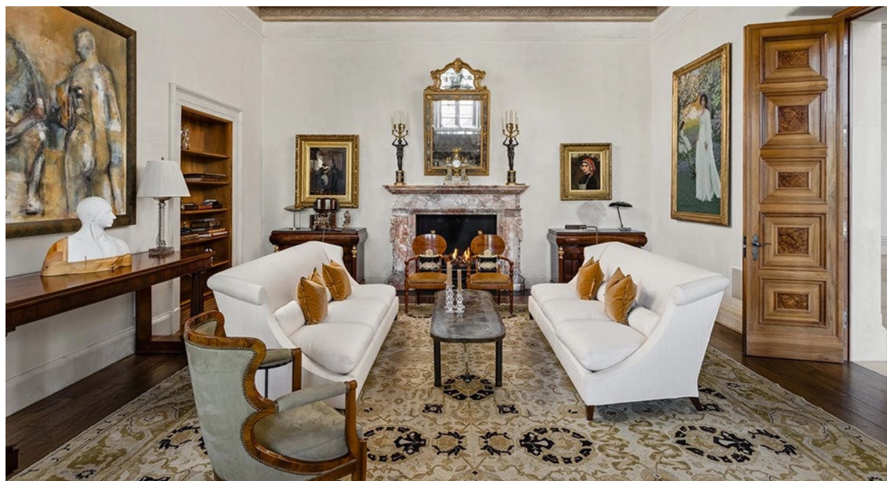
Không gian phòng khách