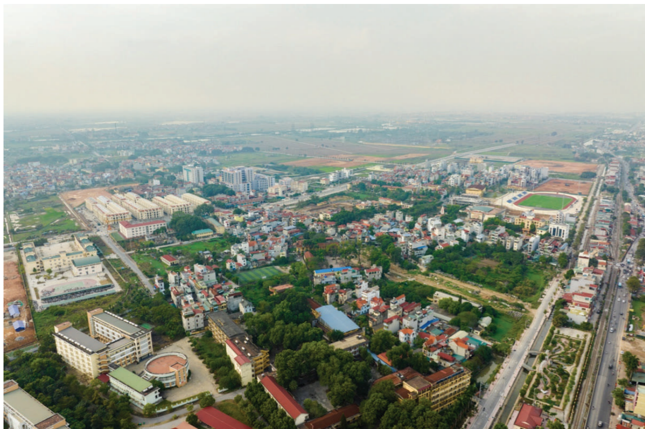
Một góc huyện Thường Tín

Nhận định này đến từ việc thành phố đã lập quy hoạch phân khu tỷ lệ 1/2000 khu công nghiệp Bắc Thường Tín rộng 112 ha. Nằm trên địa bàn các xã Liên Phương, Văn Bình, đây sẽ là khu công nghiệp thứ 12 trên địa bàn Thường Tín.