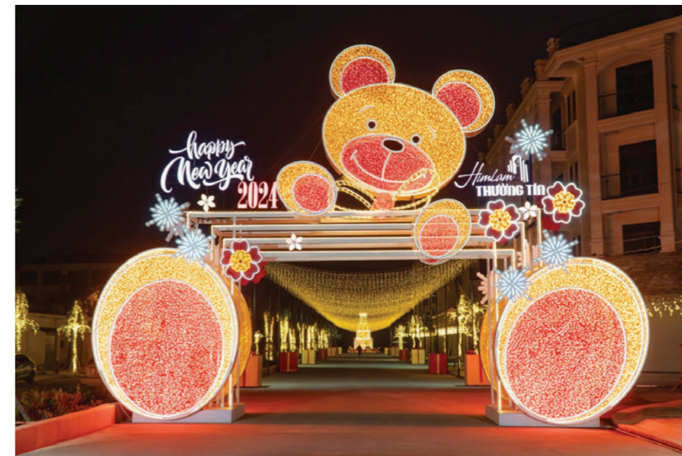
Cổng chào gấu Teddy khổng lồ, điểm nhấn tại "Thành phố ngàn ánh sáng" - Him Lam Thường Tín.

Ngoài ra, tháp hộp quà khổng lồ cao đến 8m cũng là một điểm check in độc đáo không thể bỏ qua tại dự án Him Lam Thường Tín. Dọc tuyến lòng đường nội khu dự án được trang trí khung đèn dài bao quanh, tạo nên không gian check in lung linh và huyền ảo.