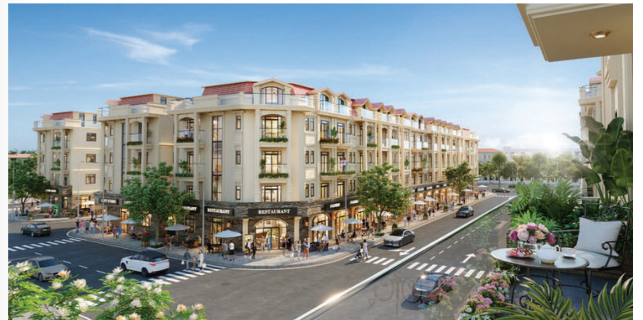
Him Lam Thường Tín - dự án “hiếm có” được sở hữu lâu dài

Him Lam Thường Tín là một trong số ít những dự án gần hoàn thiện mới mở bán và sở hữu pháp lý hoàn chỉnh tại cửa ngõ phía Nam Thủ đô. Đại diện đơn vị Phát triển và Kinh doanh nhấn mạnh, các căn shophouse tại đây đều đã có sổ hồng lâu dài và đang khẩn trương hoàn thiện các hạng mục thi công, khách hàng có thể tới tận nơi để “mục sở thị”, đánh giá về chất lượng công trình cũng như hạ tầng tiện ích, thiết kế, dễ dàng kiểm chứng và đánh giá được hiệu quả sinh lời thực tế tại dự án.