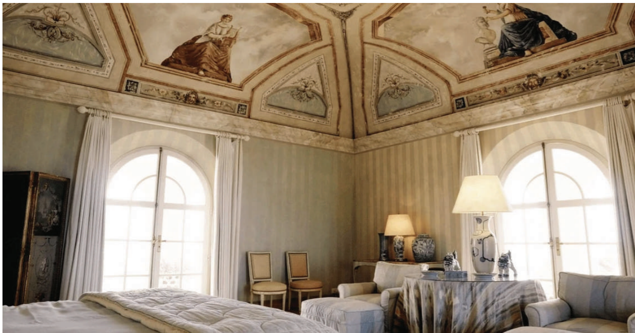
Căn dinh thự được xây dựng vào năm 1986 dưới sự chỉ đạo của kiến trúc sư Tom Wilson. Những bức vẽ trên trần nhà được thực hiện bởi họa sĩ người Pháp Jean-Claude Adenin.