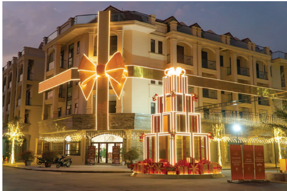
Him Lam Thường Tín - "điểm sáng" của thị trường BĐS phía Nam Thủ đô

Đây là một trong số ít những dự án gần hoàn thiện mới mở bán và sở hữu pháp lý hoàn chỉnh tại cửa ngõ phía Nam thủ đô. Các căn shophouse tại đây hiện đã có sổ hồng lâu dài và đang khẩn trương hoàn thiện các hạng mục thi công, khách hàng có thể tới tận nơi đánh giá về chất lượng công trình cũng như hạ tầng tiện ích, thiết kế và hiệu quả sinh lời thực tế của dự án.