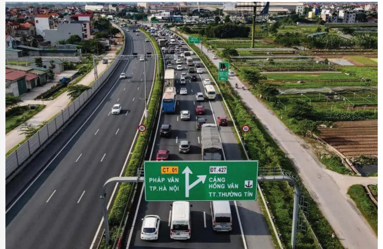
Tuyến cao tốc huyết mạch Pháp Vân- Cầu Giẽ đoạn đi qua địa phận huyện Thường Tín

Cùng với những tuyến cao tốc này, vành đai 4 sẽ là trục phát triển quan trọng thúc đẩy sự phát triển của Thường Tín. Tuyến đường Vành đai 4 thuộc địa phận TP Hà Nội có chiều dài 58,2km, đi qua 7 quận huyện gồm: Sóc Sơn, Mê Linh, Đan Phượng, Hoài Đức, Thanh Oai, Thường Tín và quận Hà Đông. Năm 2024, đường Vành đai 4 - Vùng Thủ đô là một trong những dự án trọng điểm quốc gia được thành phố tập trung triển khai. Tại địa phận huyện Thường Tín, tuyến vành đai 4 dài khoảng 9,3 km. Hiện nay, đoạn đường này đang dần hình thành. Trên công trường, máy móc và công nhân đang rầm rộ thi công.