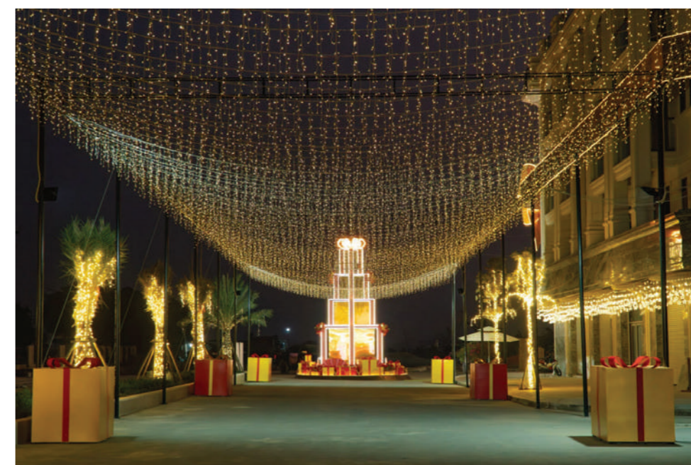
Lối đi vào dự án được trang hoàng ánh sáng rực rỡ

Công trình trang trí được xem là một biểu tượng năm mới rực rỡ tại Thường Tín khi mang đến sức sống mới hiện đại, sống động và đầy sức hút. Với tâm huyết kiến tạo nên một biểu tượng thương mại, tài chính dành cho giới thượng lưu đầu tiên tại Thường Tín, đây chính là món quà mà nhà phát triển và kinh doanh dự án - Trường Sơn Land muốn gửi gắm tới mảnh đất này.