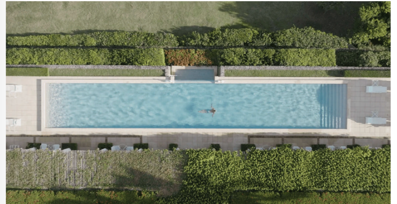
Nhiều chi tiết trong phần nội thất được mạ vàng. Ngoài ra, dinh thự còn có một hội trường lớn và khu vực dành riêng cho các hoạt động thể thao như bóng bàn, bida và cờ vua.