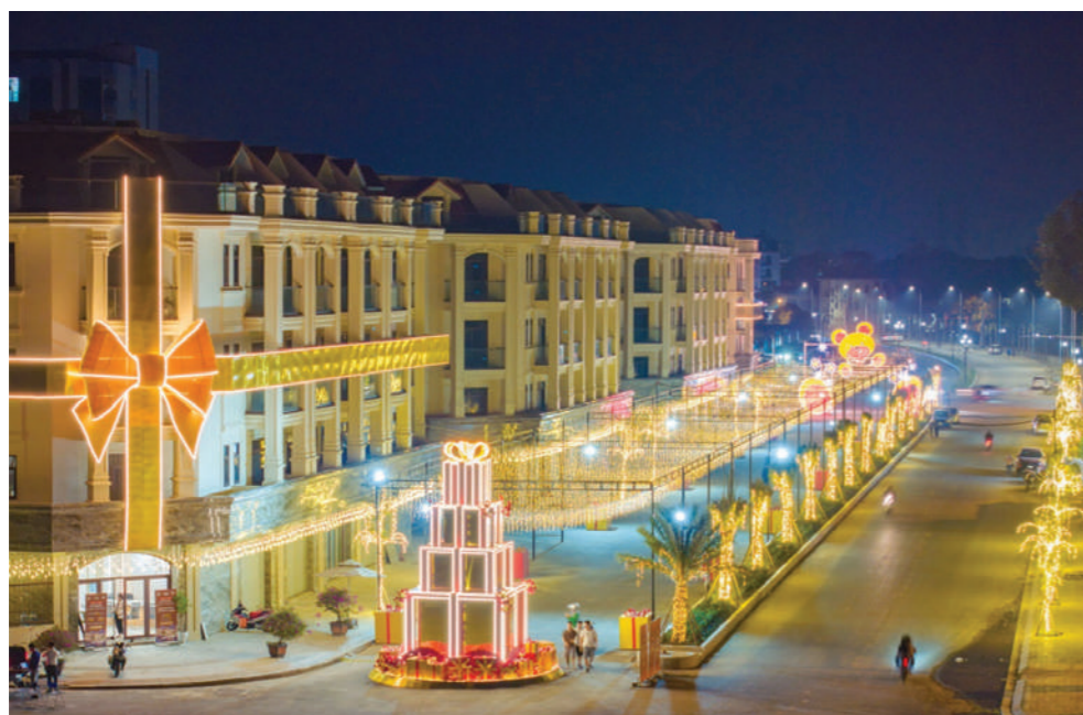
Him Lam Thường Tín - "điểm sáng" của thị trường BĐS phía Nam Thủ đô

Vào những ngày cuối năm trước khi bước qua thêm năm mới Giáp Thìn 2024, người dân khi đi qua dự án Him Lam Thường Tín ấn tượng bởi hệ thống đèn led rực rỡ được trang trí sinh động. Với số lượng đèn led trang trí lên đến 180.000 bóng, Him Lam Thường Tín khoác lên mình diện mạo mới lộng lẫy chào đón năm mới.