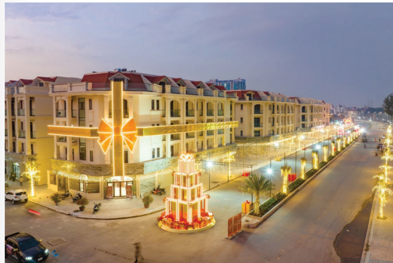
Dự án Him Lam Thường Tín được quy hoạch thành phố thương mại kiểu mẫu ở khu vực