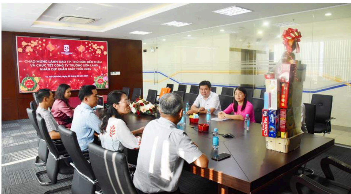
Lãnh đạo Tp. Thủ Đức đến thăm và chúc Tết công ty Trường Sơn Land