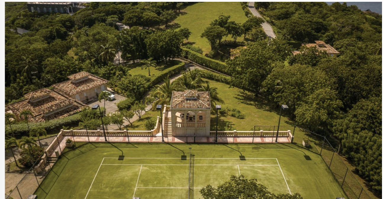
Nơi đây còn sở hữu khu nhà ở dành riêng cho khách với diện tích hơn 241 m 2 . Nếu một người nước ngoài muốn mua bất động sản này, họ có thể phải trả khoản thuế và phí tương đương 12% giá trị căn dinh thự, khoảng 24 triệu USD.