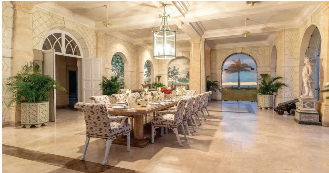
Giá nhà đất tại Mustique đã tăng 12% trong năm 2022. Vào năm ngoái, bất động sản có giá trị giao dịch lớn nhất tại đây đạt khoảng 35 triệu USD.