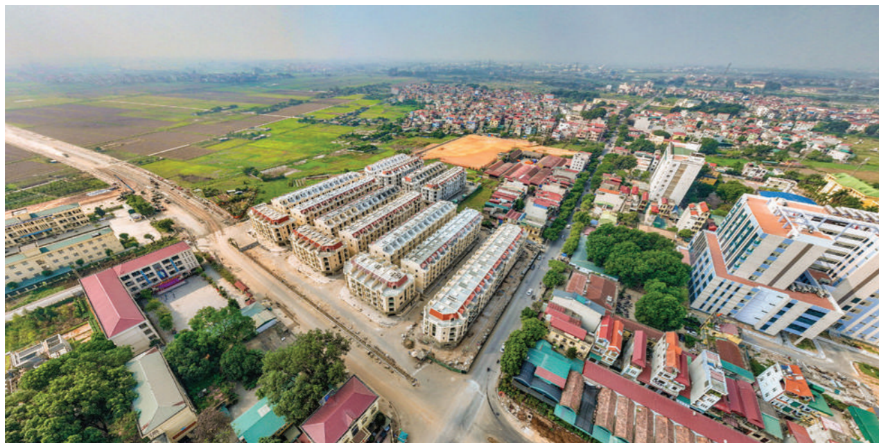
Him Lam Thường Tín - “điểm sáng” của thị trường BĐS phía Nam Thủ đô

Ngay khi vừa “lên sóng” thị trường bất động sản, Him Lam Thường Tín được nhận định là dự án tâm điểm trong việc tiên phong “khai phá” khu vực cửa ngõ phía Nam Thủ đô. Trong đó, việc liên tục được đầu tư về hạ tầng, mạng lưới giao thông huyết mạch mở rộng cả về: đường bộ, đường sắt, đường thủy cũng trở thành lợi thế giúp Him Lam Thường Tín sở hữu tiềm năng tăng giá vượt thời gian trong tương lai gần.