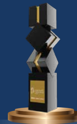
Doanh nghiệp xuất sắc Châu Á năm 2022