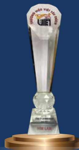
Thương hiệu Việt yêu thích 2020