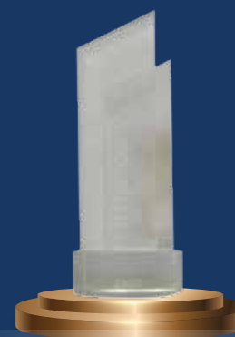
Shophouse tốt nhất Việt Nam 2020