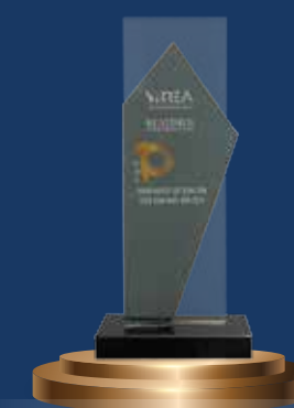
Top 10 doanh nghiệp BĐS triển vọng nhất năm 2024