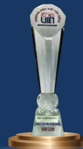
Thương hiệu Việt yêu thích 2019