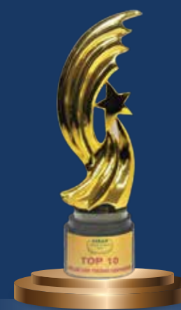
Thương hiệu mạnh Asean 2019

Top 10 doanh nghiệp BĐS triển vọng nhất năm 2024 Top 10 Most Promising Real Estate Enterprises in 2024